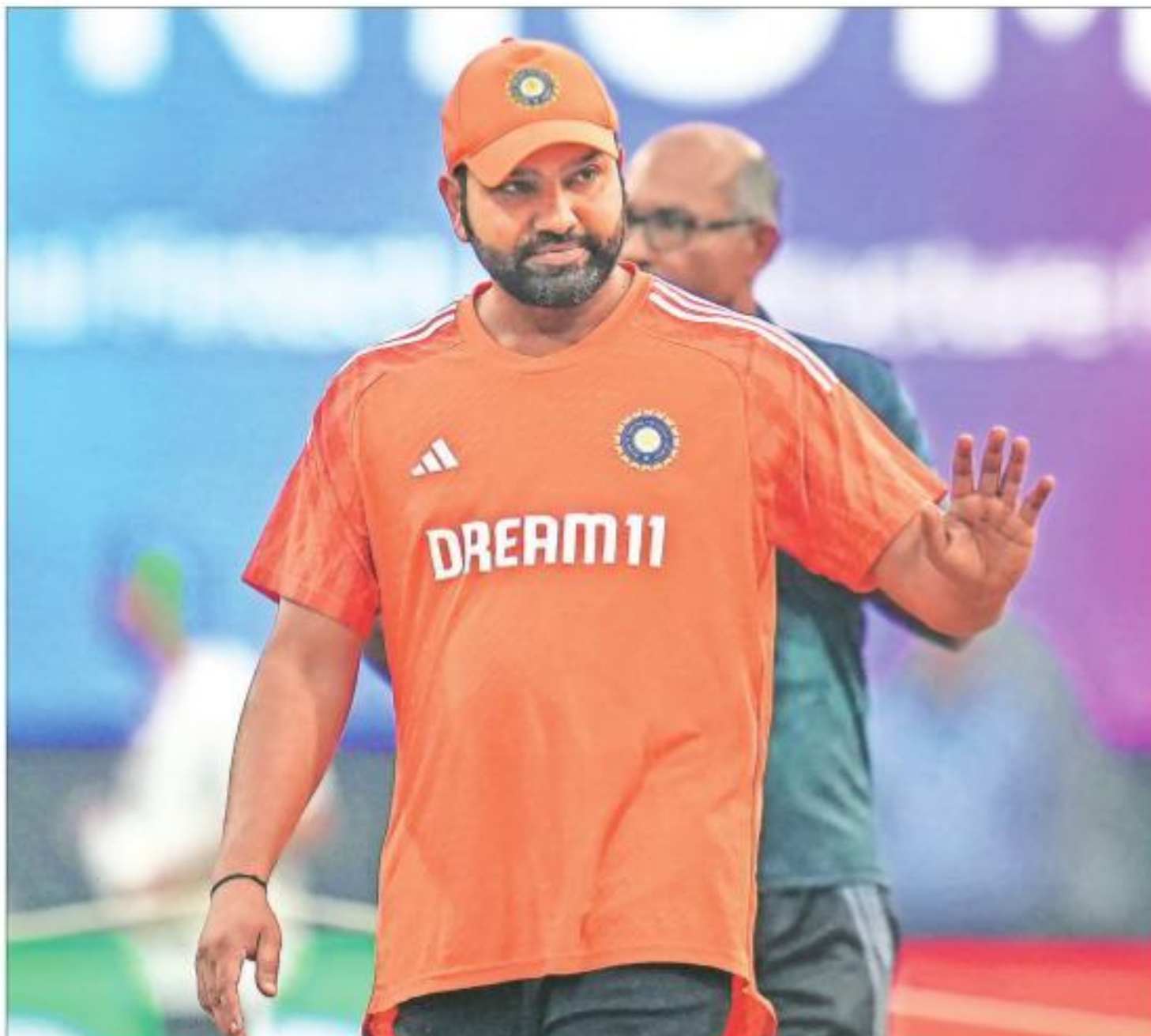
Indian captain Rohit Sharma during a practice session ahead of the ICC Men's Cricket World Cup 2023 semi-final match between India and New Zealand, at the Wankhede Stadium, in Mumbai, on Tuesday.

"First getting through the qualifying stage, then semifinal and then the final, there are processes you have to do." Or when he talked about his journey: "Honestly, no time to think about all that. Right now, it's about the business of getting the job done for the team. Perhaps after 19th November [the day of the final], I can think. We know how important this week is." Or when he spoke